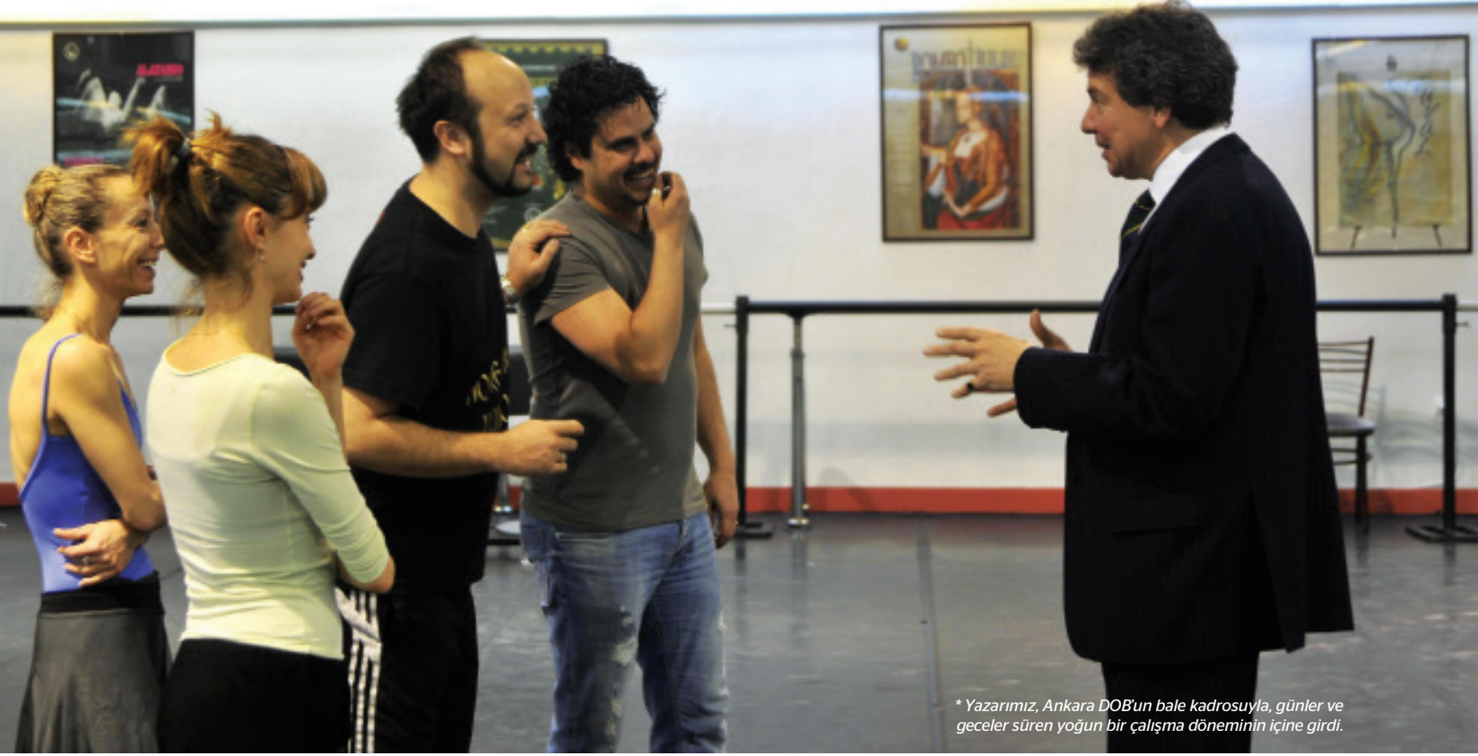
* Yazarımız, Ankara DOB'un bale kadrosuyla, günler ve geceler süren yoğun bir çalışma döneminin içine girdi.

V. Murad esasında son derece kültürlü, zarif ve sanatkâr ruhlu bir padişah'tı. Çırağan'daki günlerini de daha çok kitap okuyarak ve piyanosu başında, üzerlerine Fransızca düştüğü kısa notlarla, ailesine ithafen şaşırtıcı derecede neşeli besteler yaparak geçirdi.